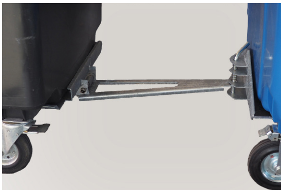
Deichsel (Ösendurchmesser 30mm) und Kupplung an den Müllbehältern

Der AWM stellt Müllbehälter mit Zugvorrichtung zur Verfügung. So können bis zu vier Behälter von einer Zugmaschine mit Dornkupplung gezogen werden. Der Kurvenradius liegt bei ca. 3 Metern.