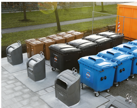
Große Müllmengen auf kleiner Fläche