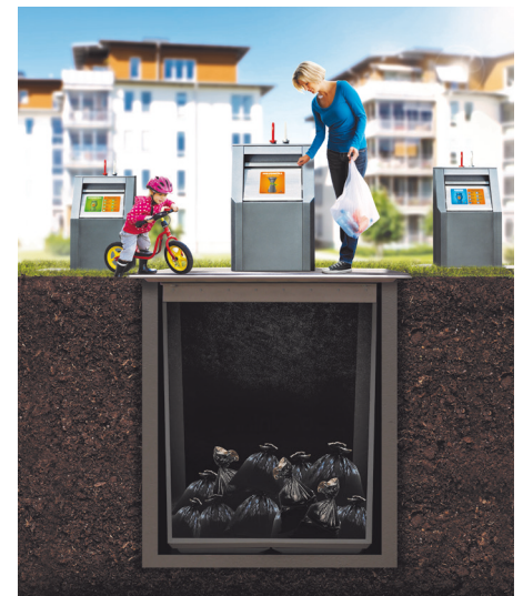
So bringen Sie Ihren Abfall weg