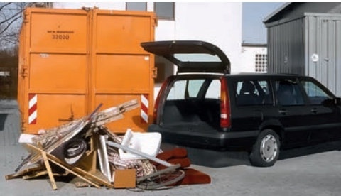
Das sind 2 Kubikmeter Sperrmüll

Wird eine der Mengenbegrenzungen überschritten, ist eine Teilabladung nicht gestattet. Haben Sie zum Beispiel 0,3 Kubikmeter Bauschutt dabei, dürfen Sie davon nicht 0,1 Kubikmeter abladen.